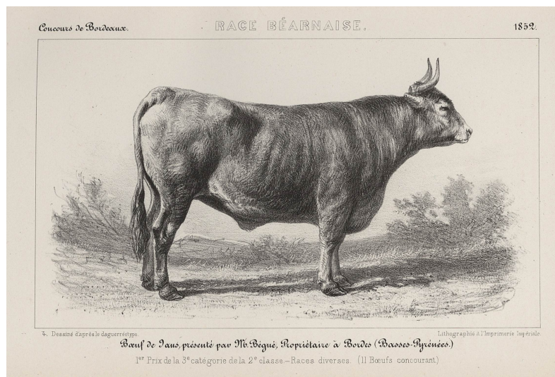
Boeuf de race béarnaise