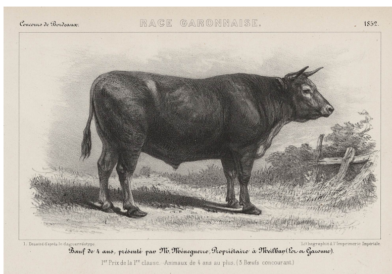
Boeuf de race garonnaise