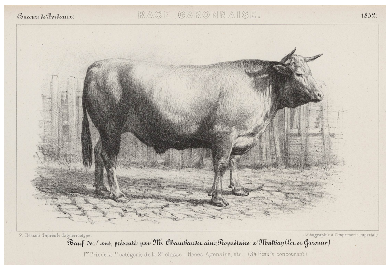
Boeuf de race garonnaise