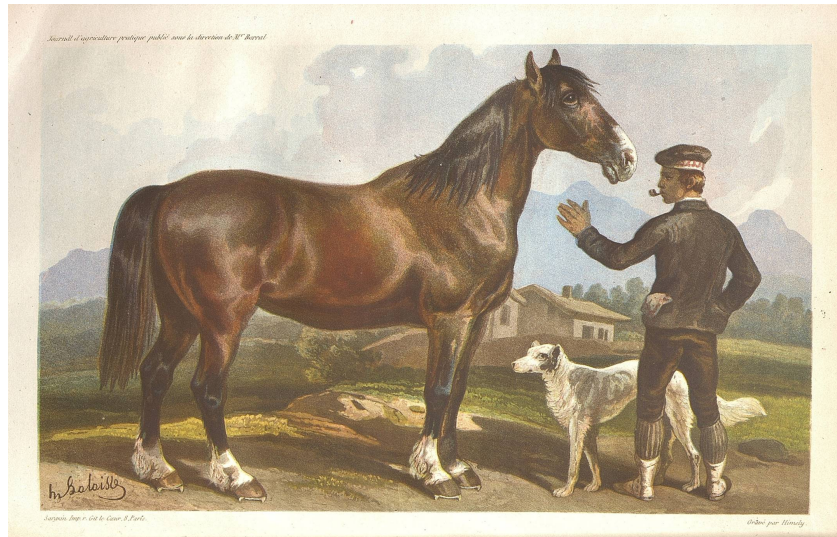
Cheval de la race Clydesdale