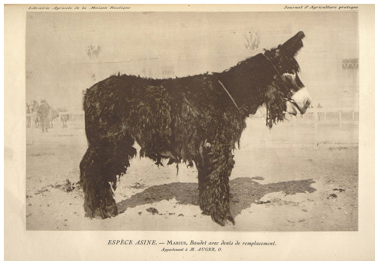
Marius, baudet avec dents de remplacement