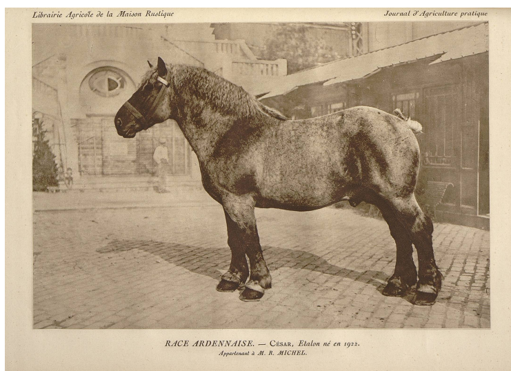
César, étalon de race ardennaise