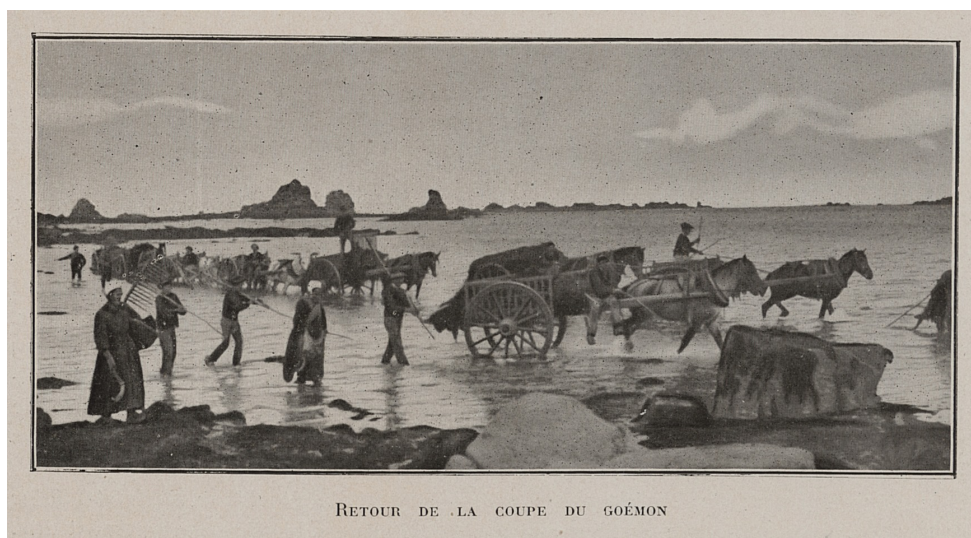
Retour de la coupe du goémon