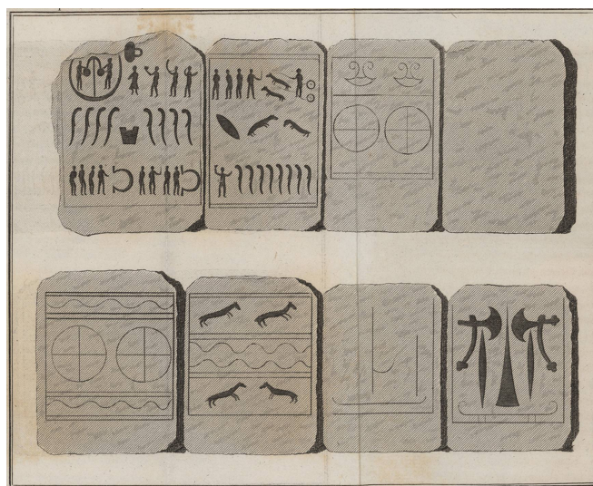
Figures du monument de Kiwik, en Scanie