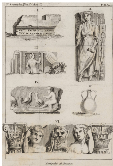
Antiquités de Beaune