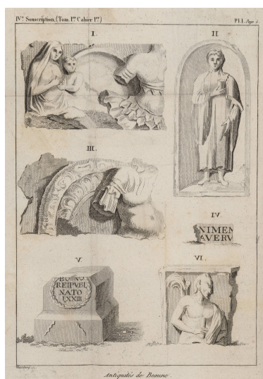
Antiquités de Beaune