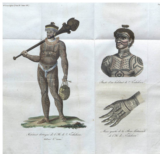
Habitant distingué de l'île de Nookahiva / Buste d'un habitant de Nookahiva / Main gauche de la reine Katanouéh de l'île de Nookahiva