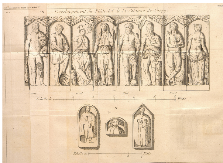
Développement du piédestal de la colonne de Cussy