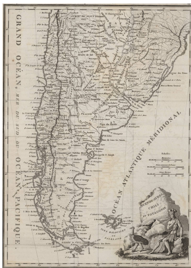
Buenos-Ayres, Chili et Patagonie