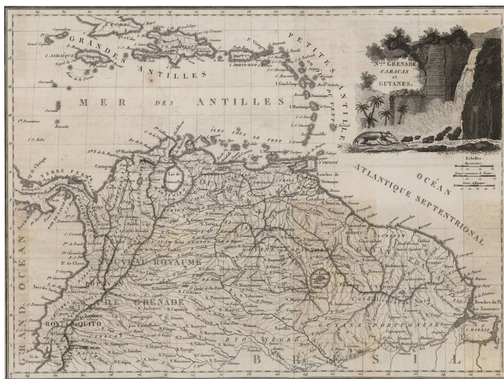
Nlle Grenade, Caracas et Guyanes