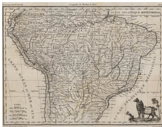
Pérou et Brésil