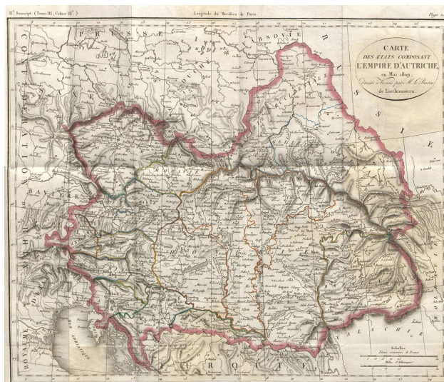
Carte des états composant l'Empire d'Autriche