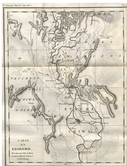
Carte de la Kharismie