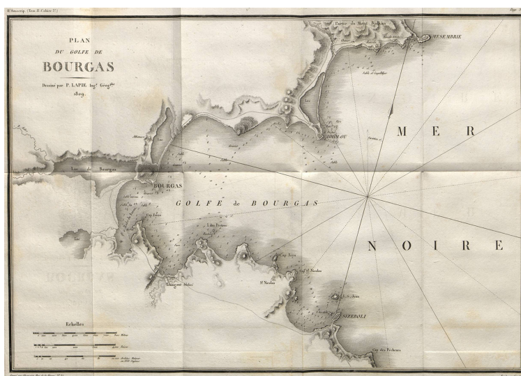
Plan du Golfe de Bourgas