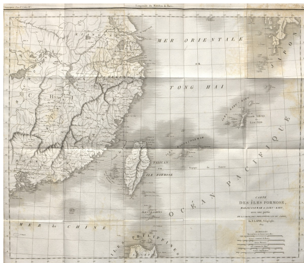
Carte des îles Formose