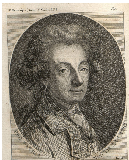
Son Altesse Monseigneur le Prince de Ligne