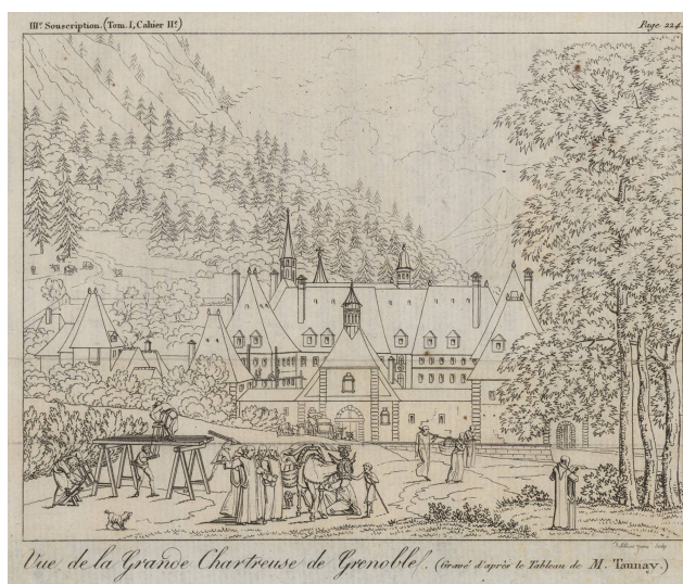
Vue de la Grande Chartreuse de Grenoble