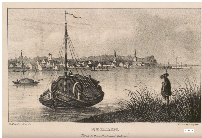
Semlin (t. 2)