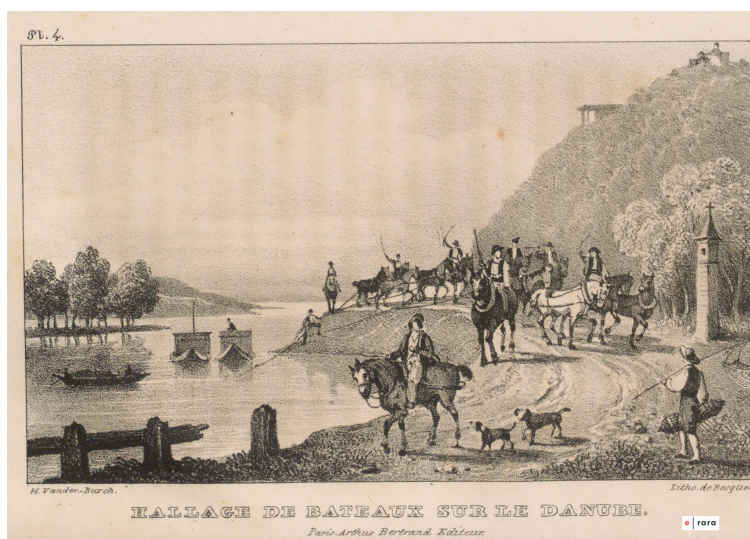
Hallage de bateaux sur le Danube (t.1 pl. 4)