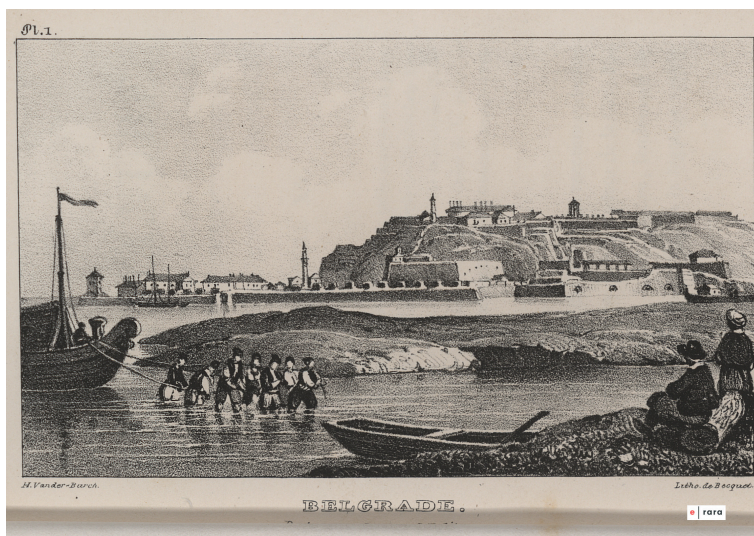
Belgrade (pl.1) t.1