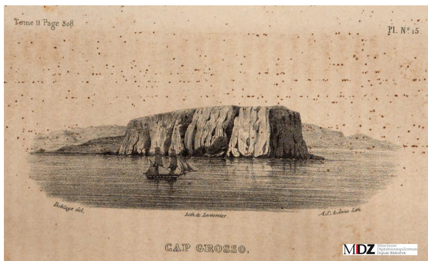
Vue du cap Grosso (t.2 p.308)