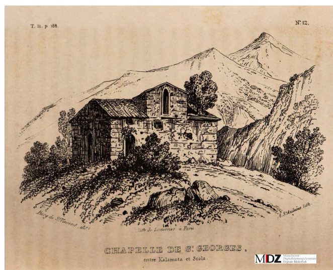
Chapelle Saint-George entre Kalamata et Skala (t.2 p .188)