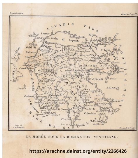
La Morée sous la domination vénitienne (t. 1 p.19)