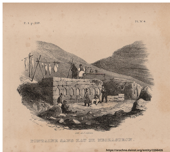
Fontaine sans eau de Néokastron (t.1 p.219)