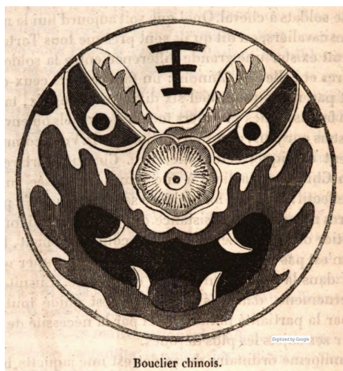
Boulier chinois t.1 p.222