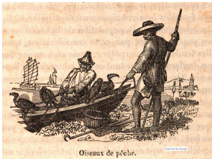
Oiseaux de pêche t.2 p.285