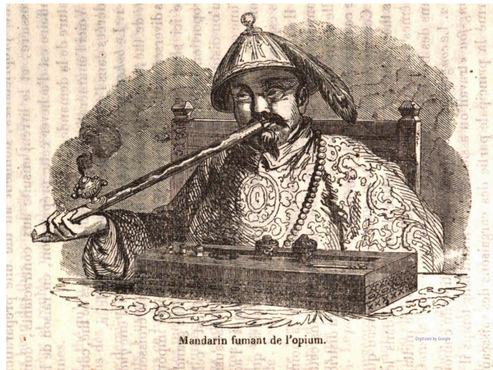
Mandarin fumant de l'opium.