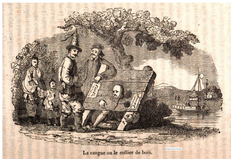
La cangue ou le collier de bois.t.1 p.232