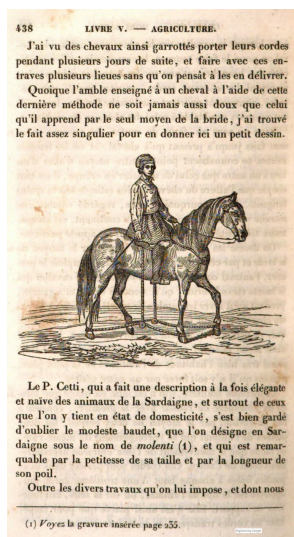
Animaux de Sardaigne domestiqués t.1 p.438