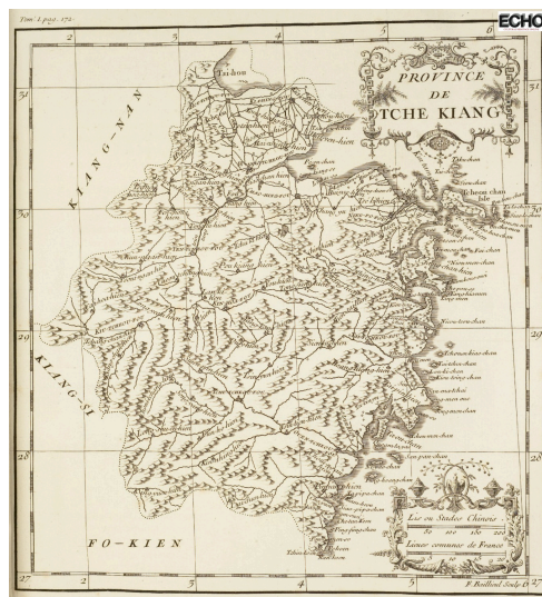
Province de Tce Kiang