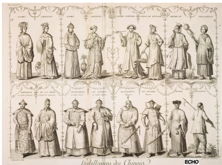
Habillemen des Chinois