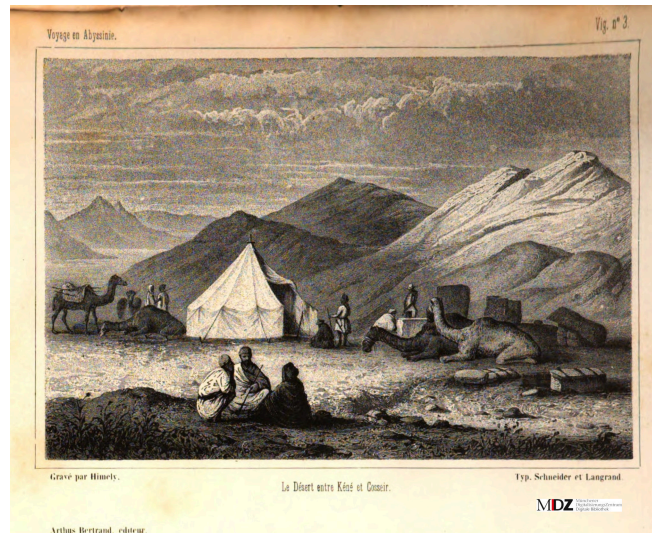
Le désert entre Kéné et Cosseir. Vignette 3