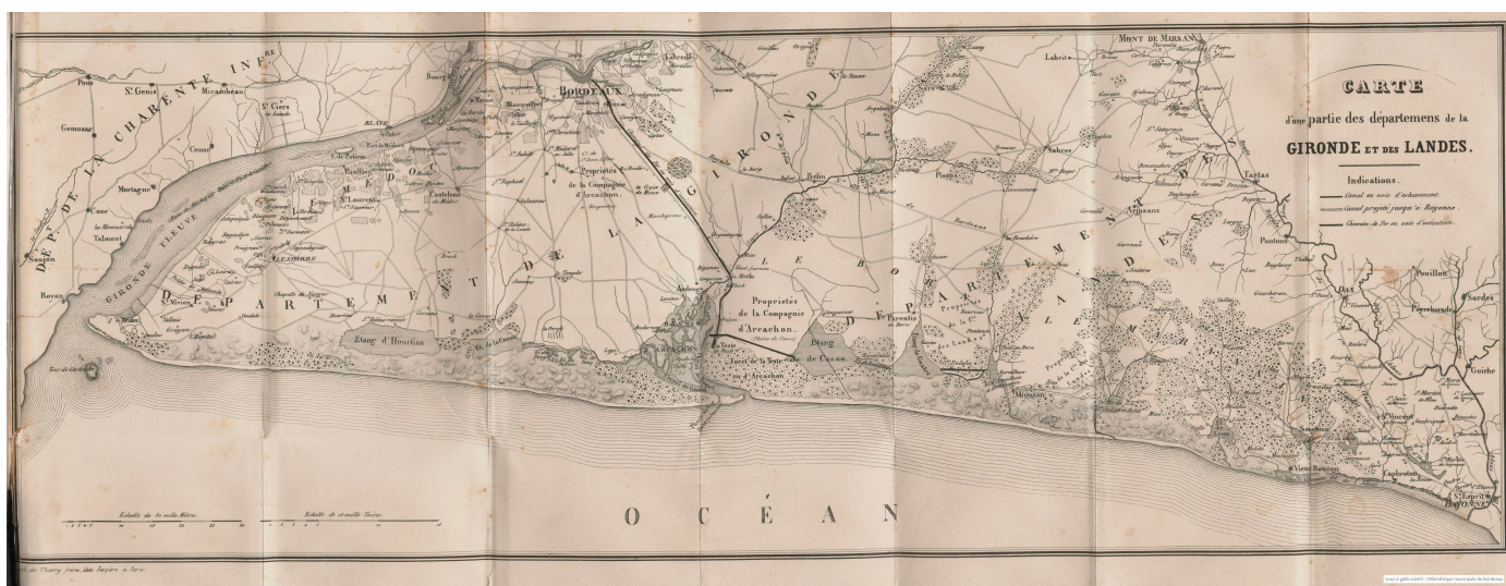
Carte d'une partie des départements de la Gironde et des Landes