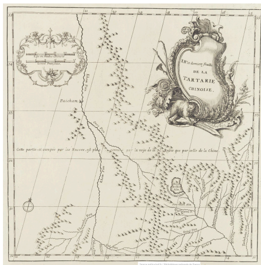
XIIe. et dernière feuille de la Tartarie Chinoise