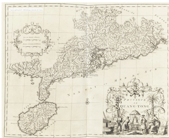
Province de Quang-Tong