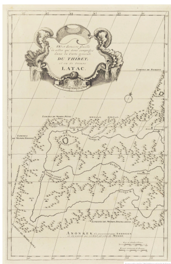
IXe. et dernière feuille de celles qui sont comprises dans la carte générale du Thibet : et ou se trouve Latac