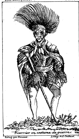
Guerrier en costume de guerre