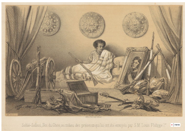
Sahie-Sallast, Roi du Choa au milieu des présents qui lui ont été envoyés par S. M. Lous Philippe 1er