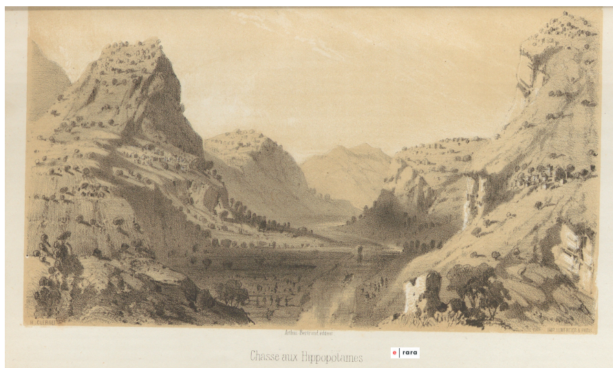
Chasse aux Hippopotames