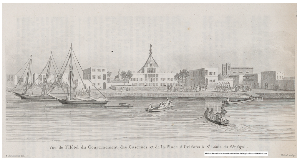
Vue de l'Hôtel du Gouvernement, des Casernes et de la Place d'Orléans à Saint Louis de Sénégal