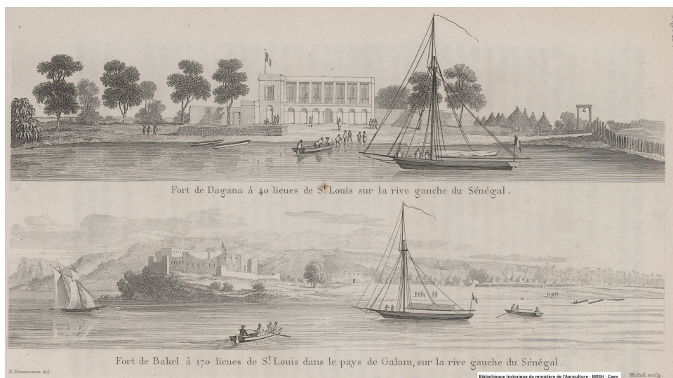
Fort de Dagana à 40 lieues de St Louis, sur le rive gauche du Sénégal / Fort de Bakel à 170 lieues de St Louis dans le pays de Galam, sur le rive gaucge du Sénégal