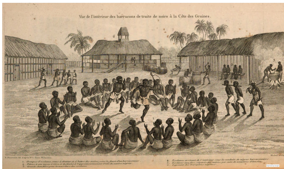
Vue de l'intérieur des barracons de traite de noirs à la Côte des Graines