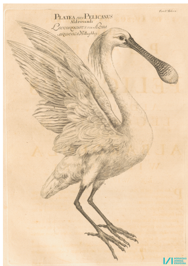
Platalea Leucorodia t. 5 (édition de 1726)