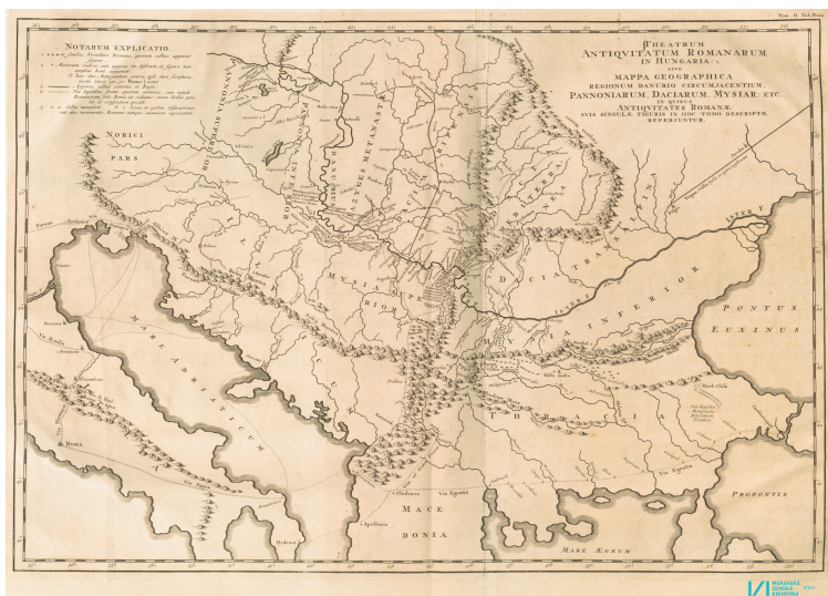
Theatrum antiquitatum romanarum... t. 2 (édition de 1726)