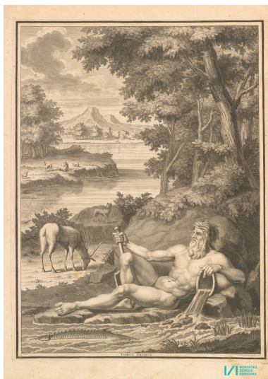
Frontispice t. 1 (édition de 1726)