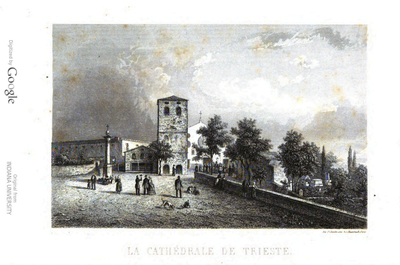
La cathédrale de Trieste (vol. 1)