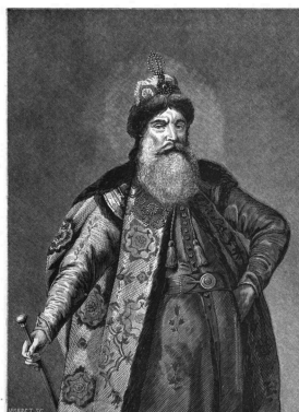
PIERRE IVANOVITCH POTEMKIN Ambassadeur en Espagne et en France (après de Louis XIV) 1667—1668