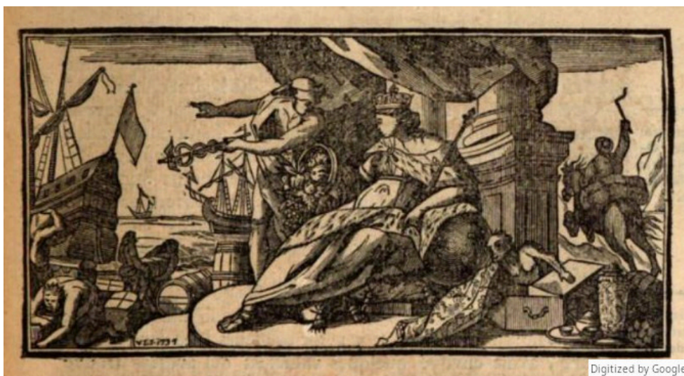
Illustration page 7