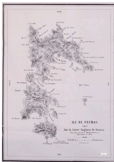
Île ancienne de Pamos