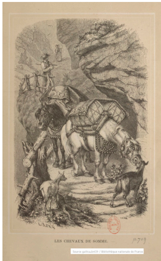
Chevaux de somme