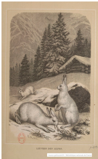
Lièvres des Alpes