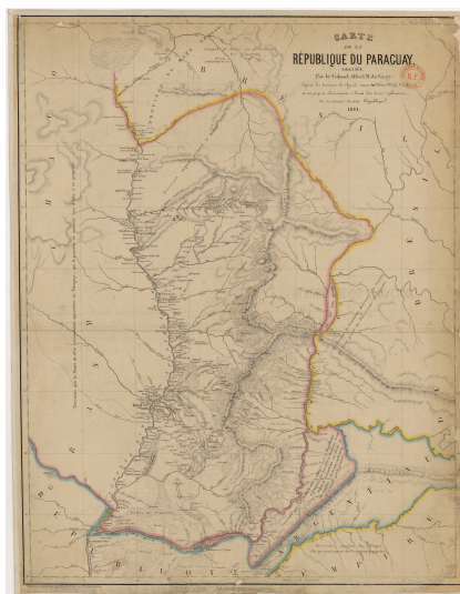
Carte du Paraguay