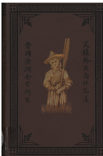
Couverture de l'ouvrage