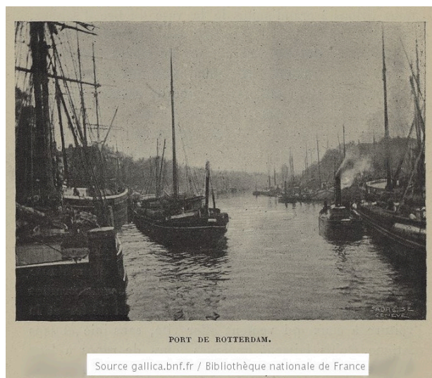
Port de Rotterdam (p. 403)