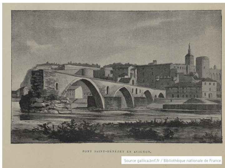
Pont Saint-Bénézé à Avignon (p. 23)