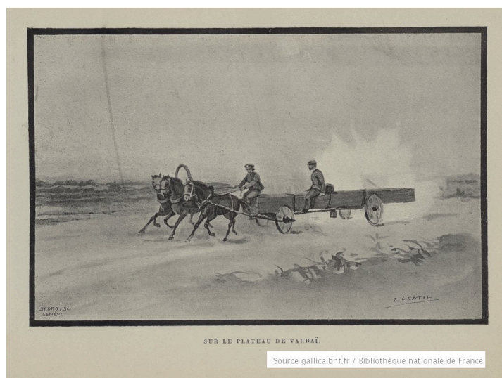
Sur le plateau de Valdai (p. 191)