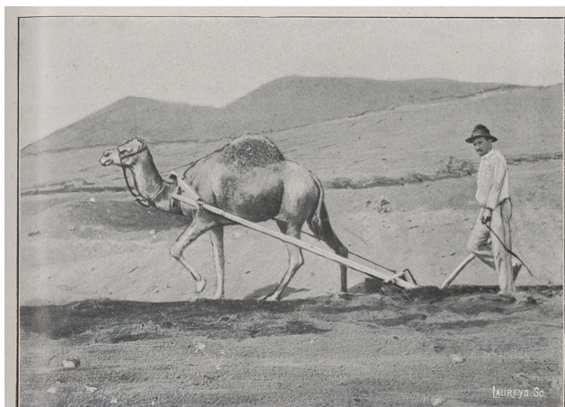
Laboureur Canarien. (Ile de Fortaventure.)