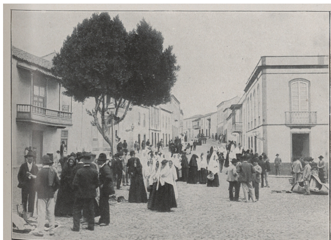
Une rue de Las Palmas un jour de marché.