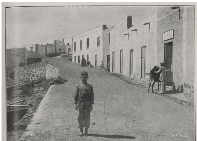
La principale rue de Puerto de Cabras, (Ile de Fortaventure.)