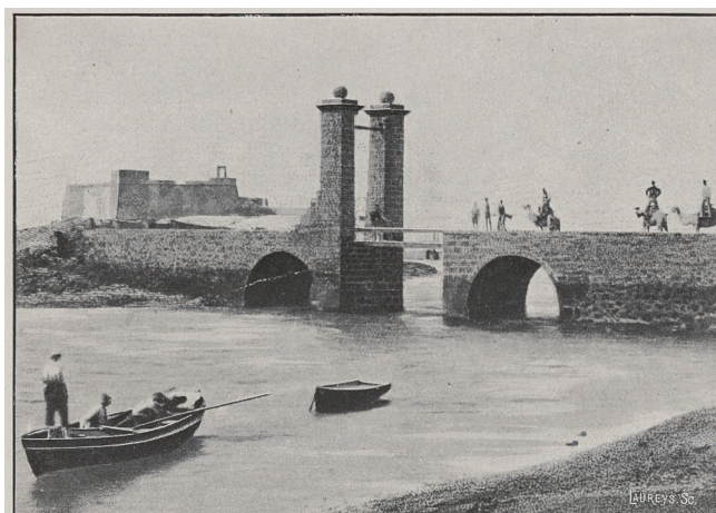
Le Castillo de San Gabriel à Arrecife. (Ile de Lanzarote.)