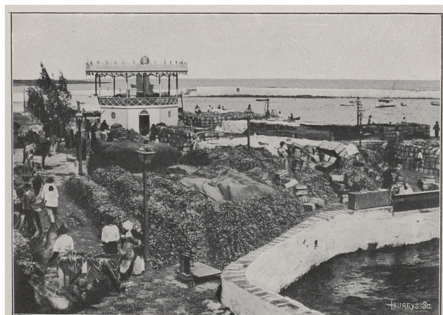
Le port d'Arrecife. Les quais, la barre de récifs. L'emballage des oignons.