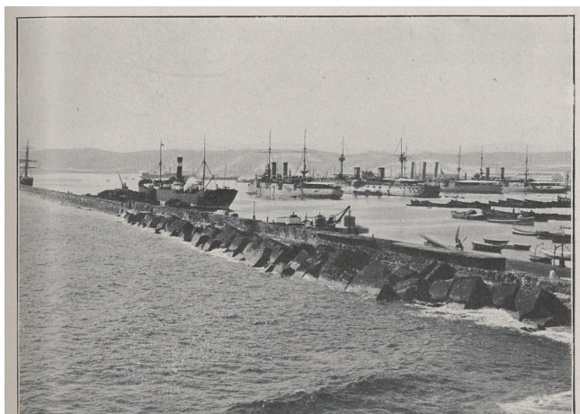
Le port de Las Palmas. (Grande Canarie.)