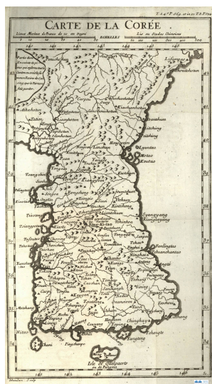
Carte de la Corée