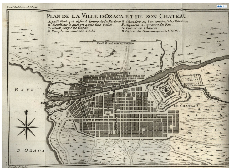
Plan de la ville d'Ozaca et de son chateau