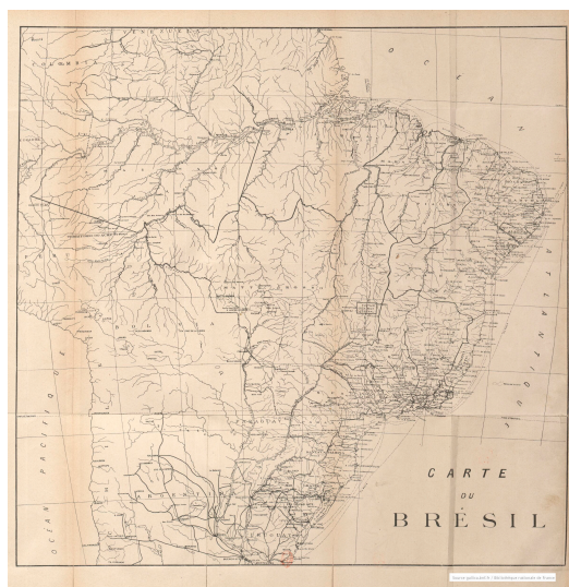
Carte du Brésil