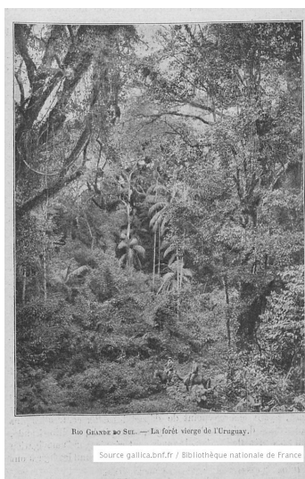
Rio Grande do Sul. La forêt vierge de l'Uruguay (p. 217)