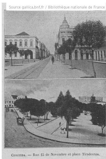
Curitiba. Rue du 15 novembre et place Tiradentes (p. 235)