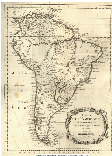
Carte de l'Amérique Septentrionale