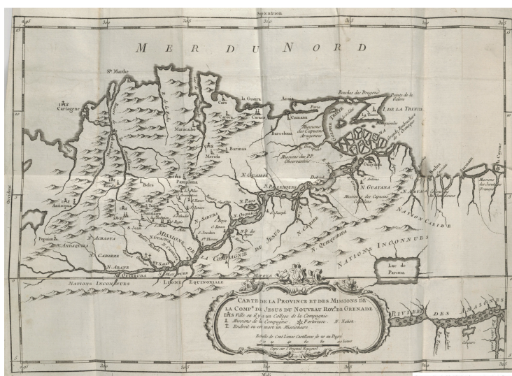
Carte de la province et des missions de la compagnie de Jesus du nouveau Royaume de Grenade