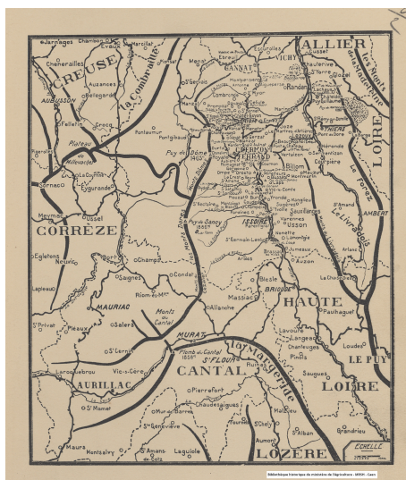
Carte de l'Auvergne