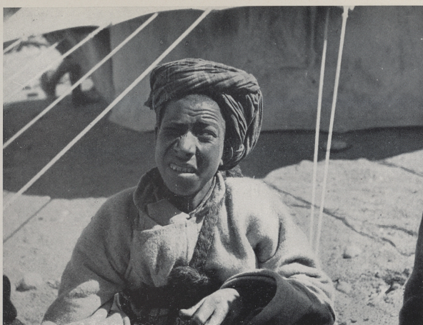
Indigène de Karghil

Bibliothèque historique du ministère de l'Agriculture - MRSH - Caen