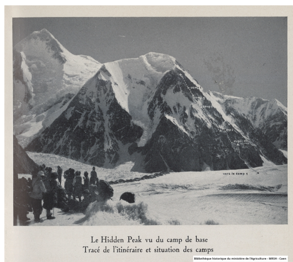
Le Hidden Peak vu du camp de base / Tracé de l'itinéraire et situation du camps