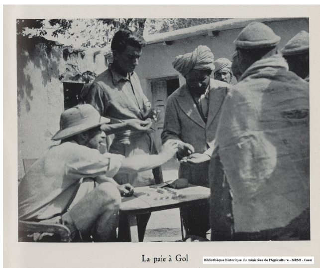
La paie à Gal