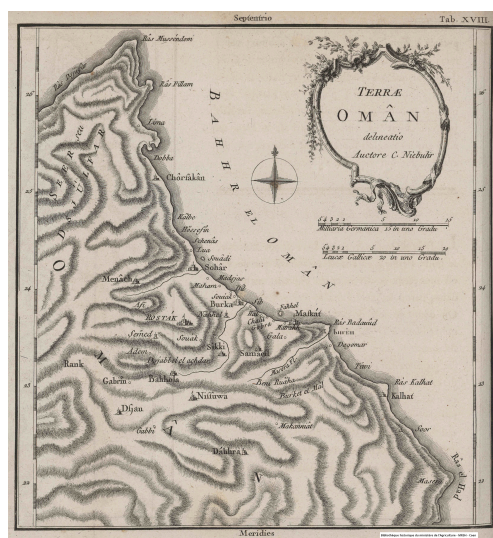
Carte de la plus grande partie de la Province d'Omân