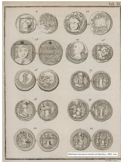
Monnoyes anciennes arabes, parthes & persanes