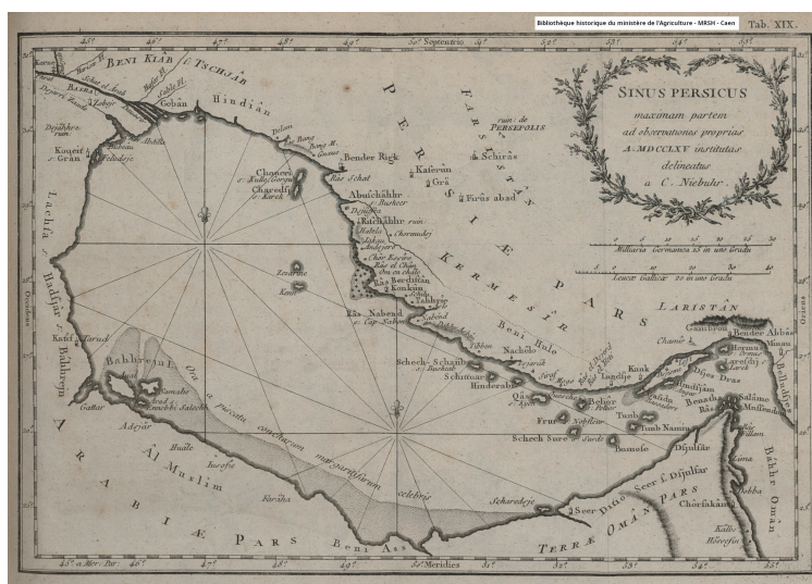
Le golfe persique