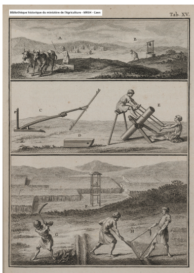
Outils pour l'agriculture des Arabes