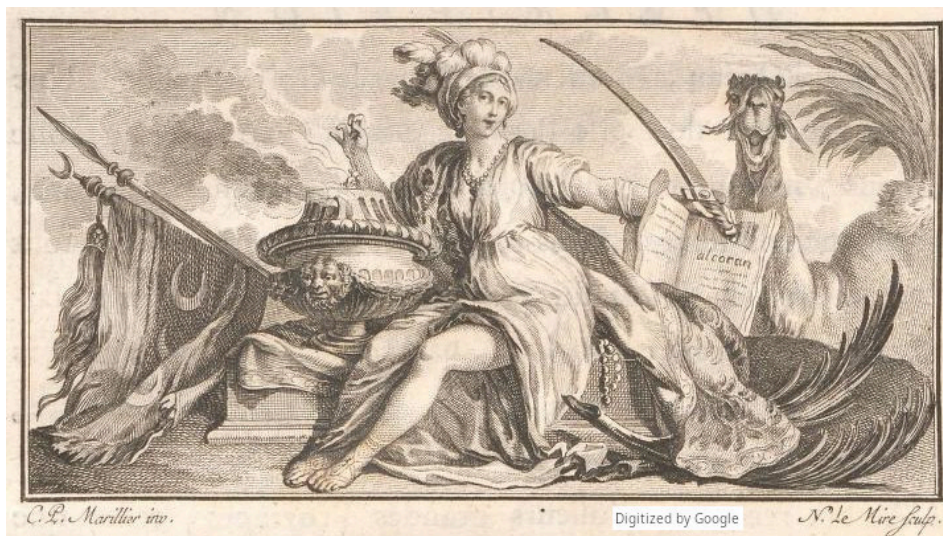
Détail page 1