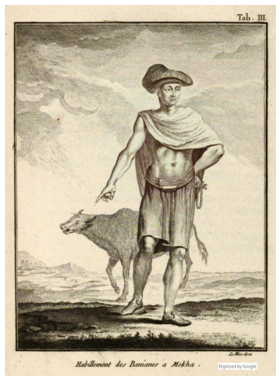
Habillemeut des Banians à Mokha