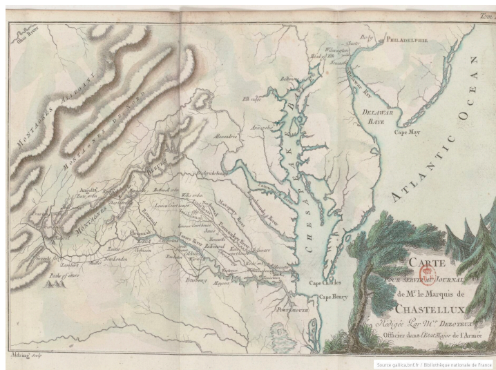
Carte pour servir au journal... tome 2