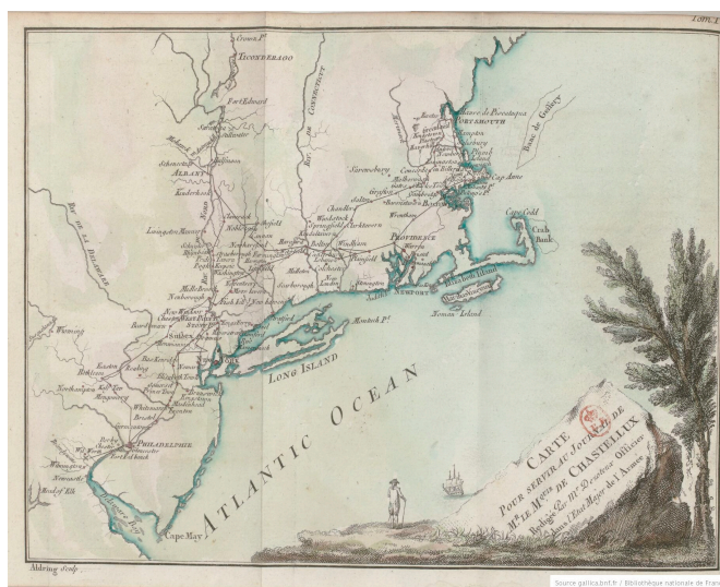
Carte pour servir au journal... tome 1