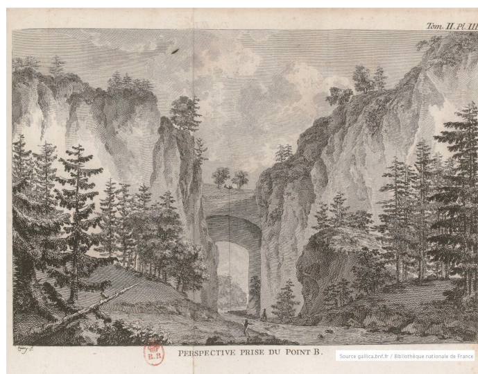
Perspective prise du point B