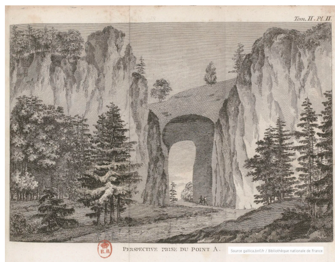
Perspective prise du point A