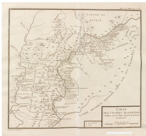
Carte des colonies allemandes établis sur le Volga dans le territoire de Saratof