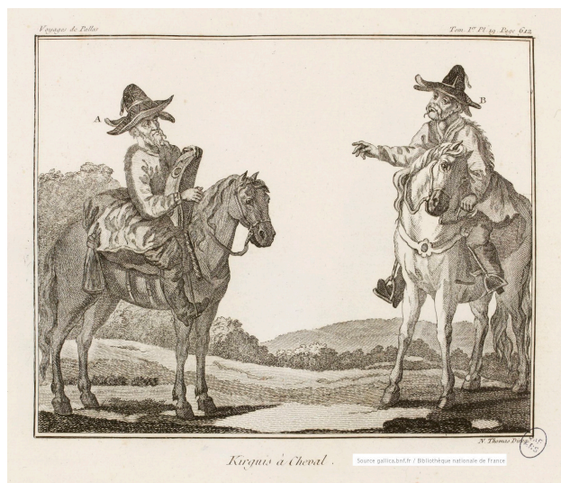
Kirguis à cheval