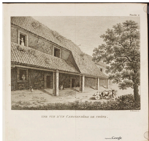
Vue d'un caravanserai de chene pl. 2