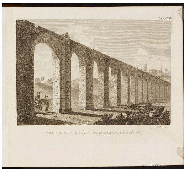
Aqueduc de Q. Sertorius à Evora pl. 16