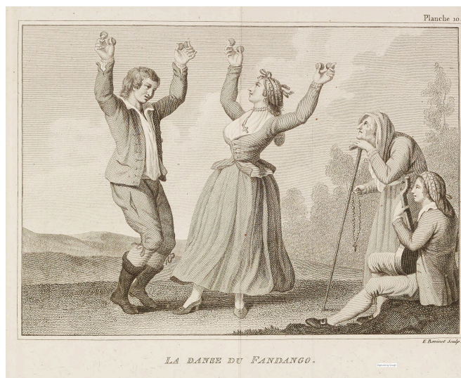
La Danse du Fandango pl. 10