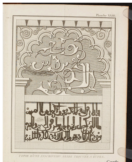
Inscription arabe pl. 23