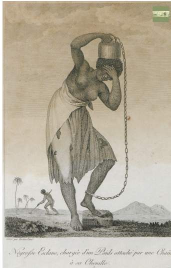
Négresse Esclave chargée d'un poids attaché par une chaîne à sa cheville pl. 4