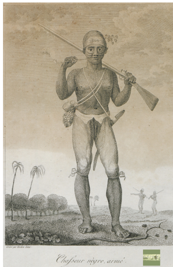
Chasseur nègre armé pl. 6