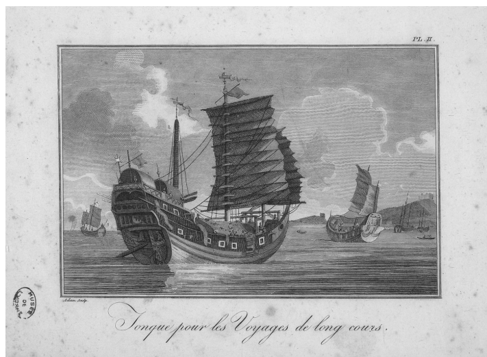
Jonque pour les voyages de long cours pl.02