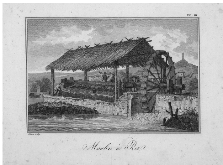
Moulin à riz pl. 03