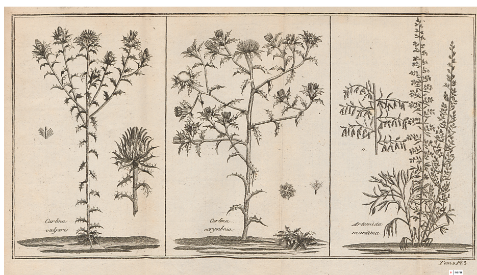
Tome 2 planche 3 - Plantes