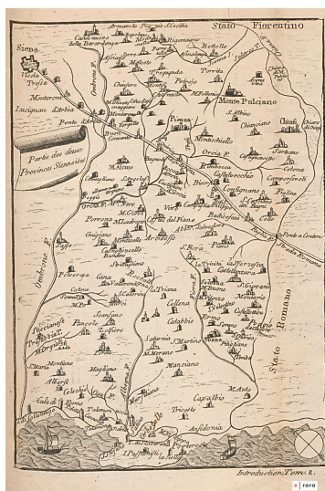
Partie des deux provinces Siennaises