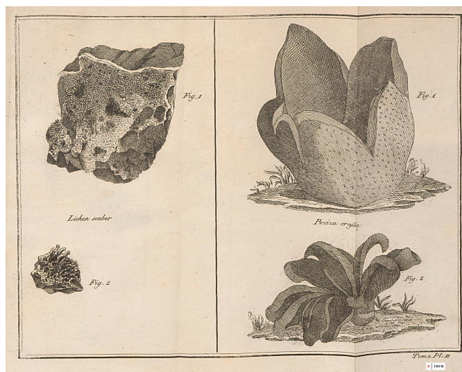
LichenscaberPeziza crafsa t.1 pl. 02