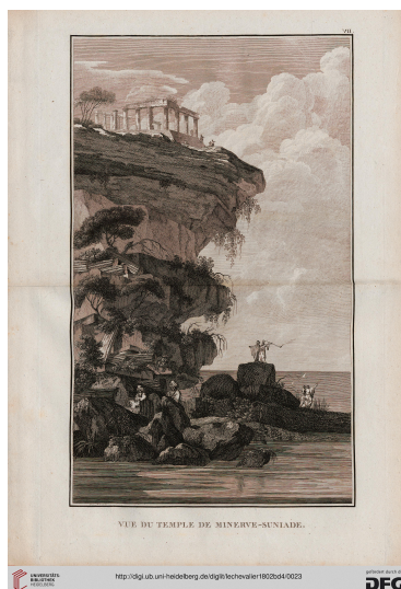
Vue du temple de Minerve-Suniade p. VII