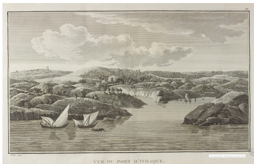
Vue du port d'Ithaque pl. IV