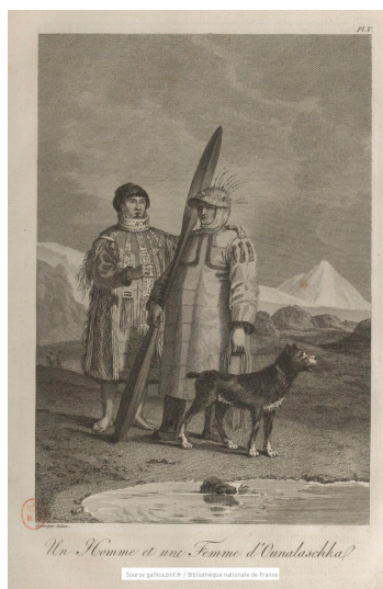
Un Homme et une Femme d'Ounalaschka pl. V