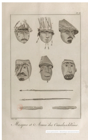
Masques et Armes des Ounalaschkans pl. XI