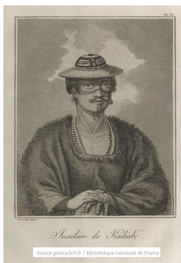
Insulaire de Kodiak pl. VI